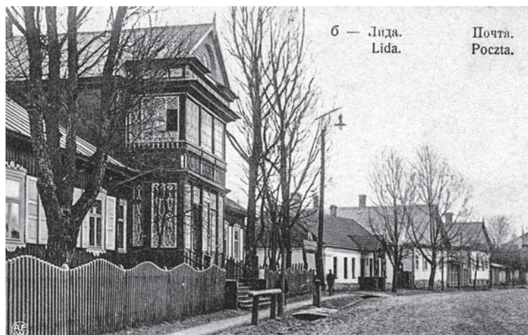
Лідская пошта ў доме Антона Малейскага, каля 1910 г.

Поштхалтары былі абавязаны ўтрымліваць на станцыях неабходную колькасць коней і перавозіць дзяржаўных пасажыраў коштам 2 капейкі (потым — 3) за каня на вярсту, а кур'ераў,