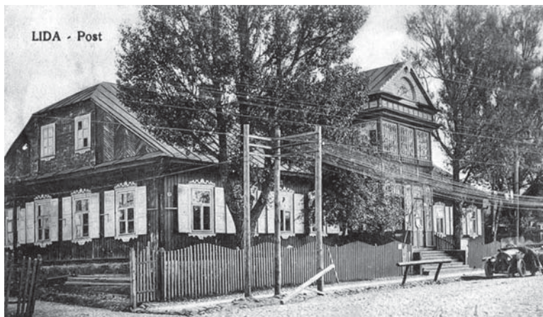
Лідская пошта ў 1917 г., бачны драты тэлефонных ліній.