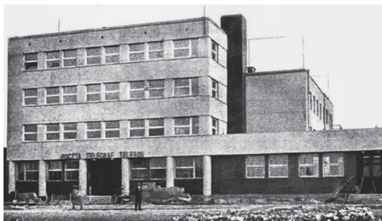
Новая лідская пошта, якая існуе і сёння, 1939 г.

Першае паведамленне пра пачатак будаўніцтва новай лідскай пошты я знайшоў у жнівеньскім нумары газеты «Кур’ер Віленскі» за 1936 г. Будаўніцтва гмаху пошты рухалася наперад. У маі 1937 г. паведамлялася, што «ў найбліжэйшыя месяцы ў новым раёне горада каля гімназіі паўстане другі гмах... Тут будзе ліставая пошта, тэлеграф