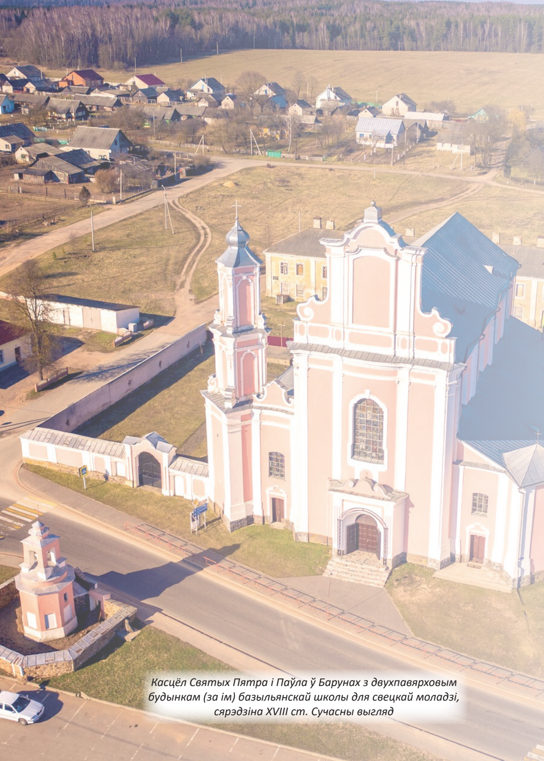
Кацёл Святых Пятра і Паўла ў Барунах з двухпавярховым будынкам (за ім) базыльянскай школы для свецкай моладзі, сярэдзіна XVIII ст. Сучасны выгляд