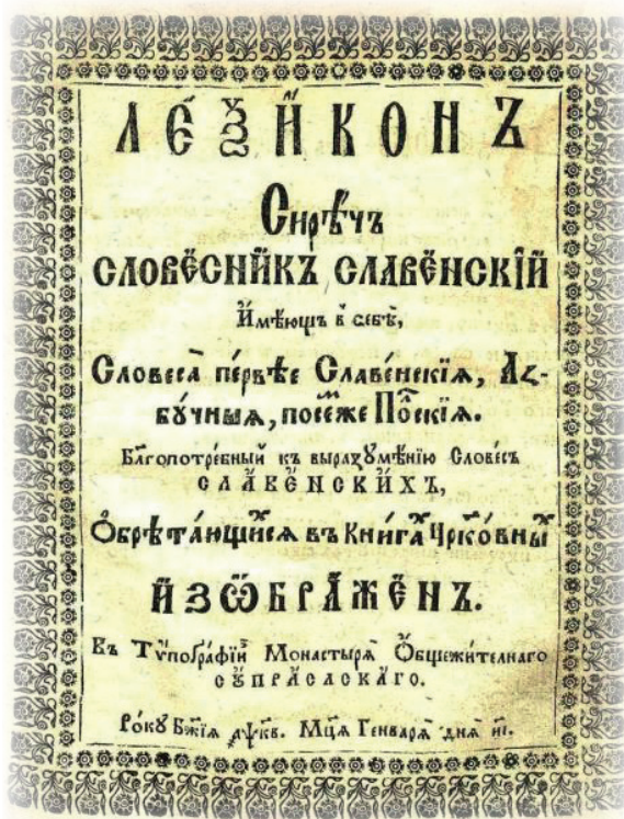
Кніжны помнік Беларусі. Лексікон Сиречь словесник славенский. Супрасль, 1722. Тытульны аркуш