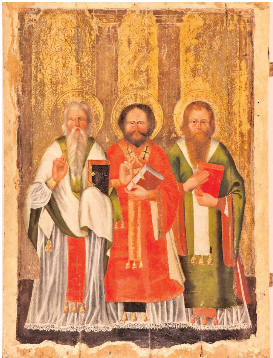
Абраз “Тры свяціцелі” (“Выбраныя Святыя Васіль Вялікі, Рыгор Багаслоў, Іаан Златавуст”) з царквы г. п. Шарашова Пружанскага р-на Брэсцкай вобл. Створаны да 1725 г. Нацыянальны мастацкі музей Рэспублікі Беларусь