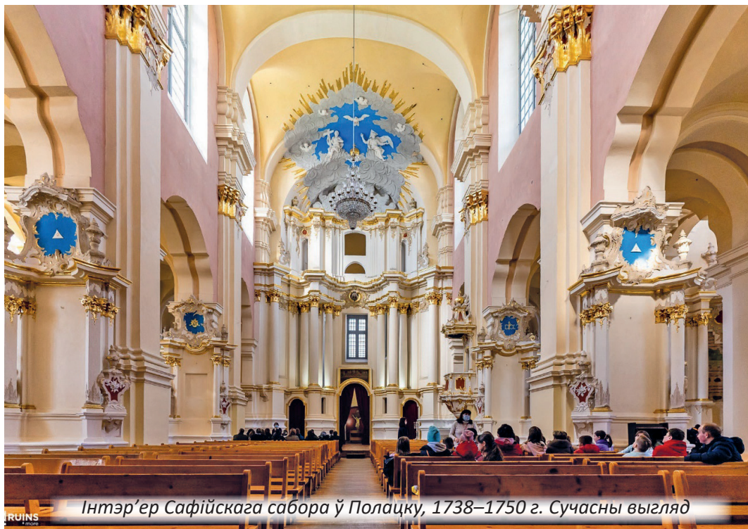
Інтэр'ер Сафійскага сабора ў Полацку, 1738–1750 г. Сучасны выгляд