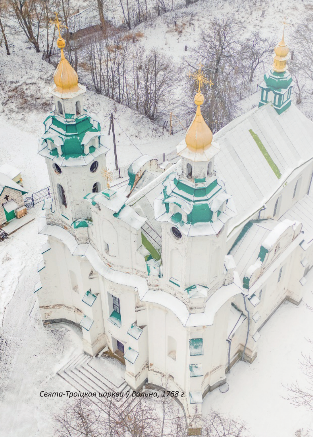
Свята-Троїцкая царква ў Вольна, 1768 г.