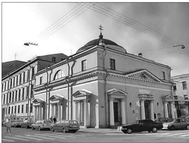
Касцёл Св. Станіслава ў Санкт-Пецярбургу. Сучасны выгляд