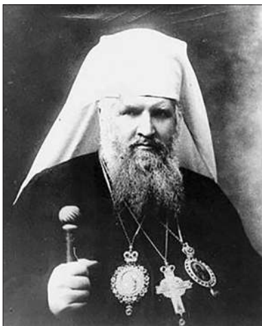
Мітраналіт Галіцкі Андрэй Шаптыцкі