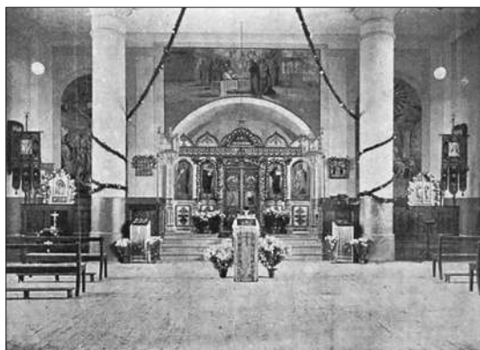
Царква ўсходняга абраду ў Альбярціне. Унутраны інтэр'ер. 1930-я гг.