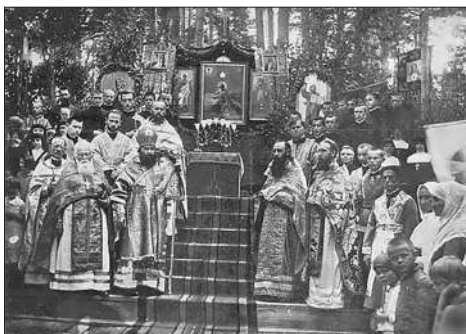
Айцы-езуіты ў Альбярціне. Пачатак 1930-х гадоў.