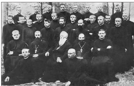
Езуіты ўсходняга абраду ў Альбярціне. Канец 1920-х гадоў.

нага яго выказвання, якое можна было б расцэньваць як палітычнае. У адрозненні ад шэрагу іншых святароў, што неслі сваё служэнне ў Заходняй Беларусі і прымалі ўдзел у грамадска-палітычнай дзейнасці, ён не ўваходзіў у склад партый і рухаў. Ён адзначаў, што «цяперашняя Унія ня мае на мэце нейкіх палітычных выгад, а толькі рэлігійныя — аб'яднаньне хрысціянаў» 28 .