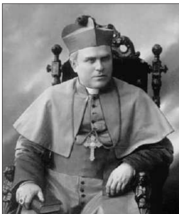
Арцыбіскуп Ян Цепляк

Руплівае служэнне а. Неманцэвіча выклікала негатыўную рэакцыю з боку савецкай улады. 25 мая 1919 г. ён упершыню быў арыштаваны за ўдзел у каталіцкай дэманстрацыі супраць арышту мітрапаліта Э. Ропы і шэсць месяцаў правёў у турме.