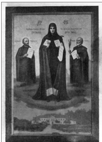
ALBERTYN. — Obraz Matki B. w sali nowiejackiej.

нейшаму прамаўляў казанні на беларускай мове 32 .