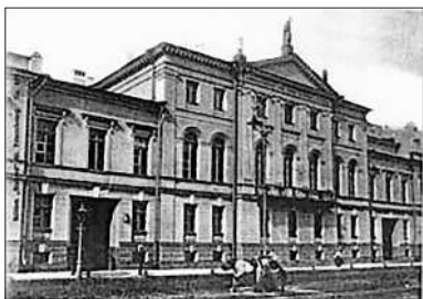
Імператарская Мітрапалітальная Рымска-Каталіцкая духоўная акадэмія ў Санкт-Пецярбургу. Фота 1914 г.

Беларускі гурток студэнтаў рымска-каталіцкай акадэміі ў Санкт-Пецярбургу быў заснаваны ў кастрычніку 1913 г. і дзейнічаў на працягу 5 гадоў, аж да закрыцця Акадэміі савецкімі ўладамі ў 1918 г. У будучым многія з удзельнікаў гуртка сталі вядомымі беларускімі рэлігійнымі, грамадскімі і культурнымі дзеячамі: Вінцэнт Гадлеўскі, Андрэй Цікота, Адам Станкевіч, Віктар Шутовіч, Карл Лупіновіч і інш. Усяго ў гуртку было 11 чалавек (для параўнання: у Акадэміі ў той час вучылася 70 студэнтаў) 6 . Узначальваў яго вядомы дзеяч беларускай куль-