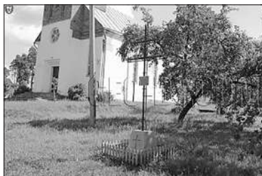
Альбарцін. Побач з касцёлам крыж памяці айцоў-езуітаў.