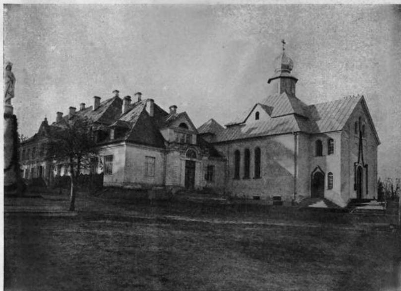
ALBERTYN. — Nowa cerkiew wschodnia i klasztor od frontu.