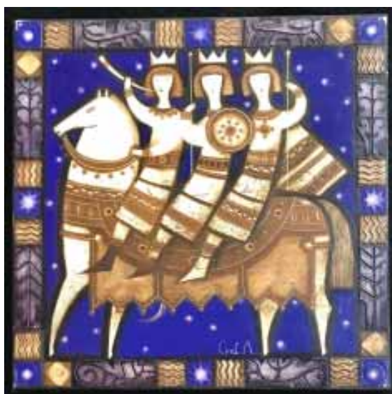
Ілюстрацыя - "Тры каралі" (А. Сільвановіч, 2020 г.)