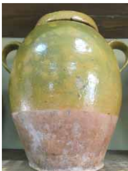
Слой (ад слова "слоік") - самы вялікі экспанат калекцыі. Ужываўся для засолкі агуркоў, яблыкаў, іншай агародніны і садавіны

У народным побыце жыхароў Лідскага краю посуд сапраўды меў рознае прызначэнне. Напрыклад, збан (гладыш, гарлач) - посуд, у якім трымалі малако. Посуд цыліндрычнай формы - слоік (слоікам у пасляваенны час у Беларусі называлі разнавіднасць шкляннага посуду). Шырокае горла глінянага слоя выраблялі з прамымі (пад накрывку) ці расхіленымі (каб завязаць паперай або тканінай) беражкамі. Аб'ём гэтага посуду мог дасягаць 20 літраў, а вышыня - паўметра. У вялікіх слоях салілі агуркі, грыбы, капусту, мачылі яблыкі. У сярэдніх і маленькіх захоўвалі мёд, тлушч, смя-