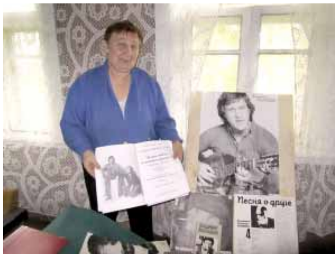
У вялешынскім музеі