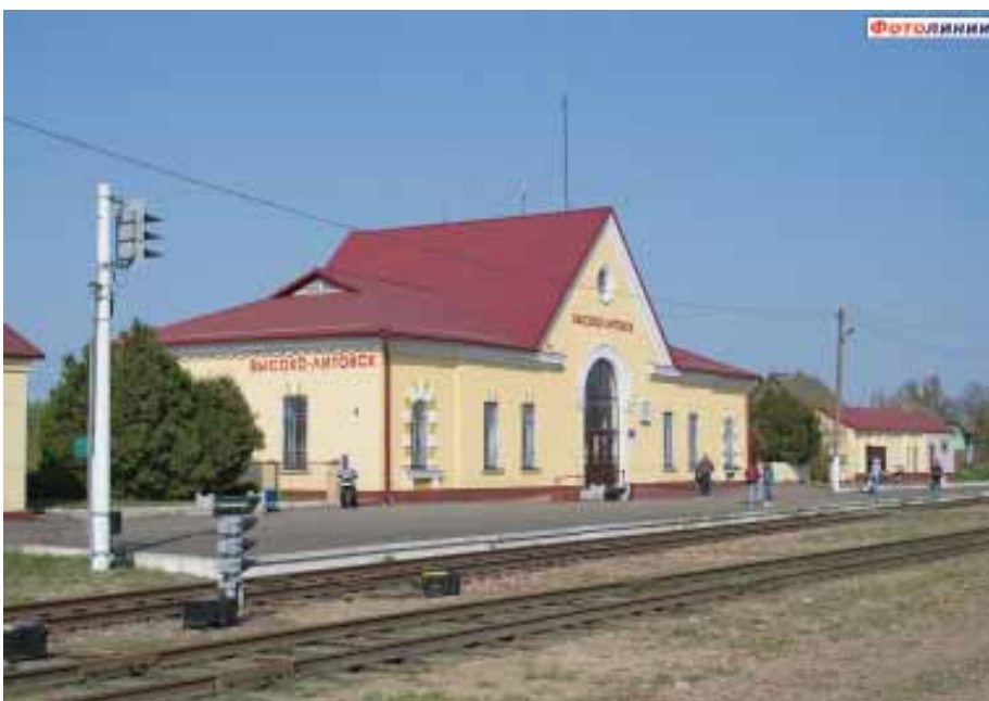
Ад гэтага Высокага як быццам паходзіць прозвішча Высоцкі

Уладзімір Высоцкі, творы якога перакладзены на 209 моў свету, быў, ёсць і заўсёды будзе з беларусамі. Каб некаму хоць нават выпадкова затаптаць ягоныя сляды - па іх трэба прайсці. А гэта, практычна, немагчыма.