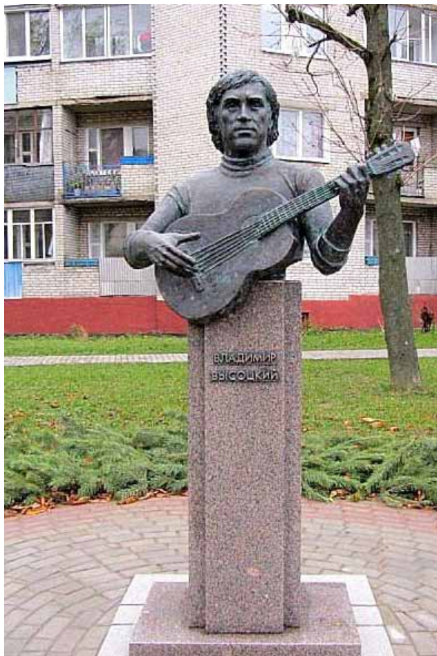
Помнік Уладзіміру Высоцкаму ў Наваградку

Тураў і Высоцкі доўга ламалі галаву над тым, якім чынам 27-гадовы чалавек, які не ваяваў, будзе прадстаўляць у "Я родам з дзяцінства" свае творы, каб яны і