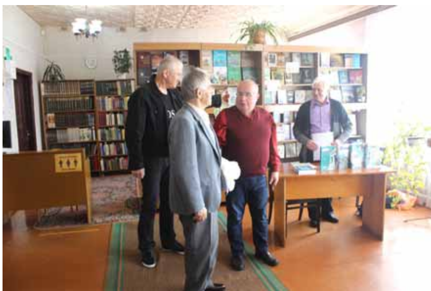
Уручэнне прэміі імя Анатоля Іверса

“Новага замка”, аналізуючы творы гарадзенскіх літаратараў. Падчас прэзентацыі пра “Новы замак” свае суб’ектыўныя думкі выказалі рэдактар выдання