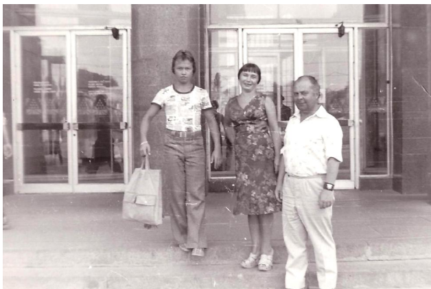
Пятрусь Макаль з жонкай Галінай і сынам Святаславам у Кіеве, 1978 г.

Пятрусь Макаль шмат пісаў пра дзяцей. У гэтых творах ён умела выкарыстоўваў беларускія фальклорныя традыцыі, узбагачаў іх, адкрываў дзецям таямніцы роднага слова, вучыў іх любіць прыроду, бацькоўскую зямлю. Юным чытачам паэт прысвяціў некалькі сваіх кніг. Сярод іх - "Хлопчык будзіць сонца" (1966), "Песня згоды" (1983), "Чарадзейная скарбонка" (1987), "Я гатую абед" (1989). Наш зямляк пісаў казкі, апавяданні і нават загадкі.