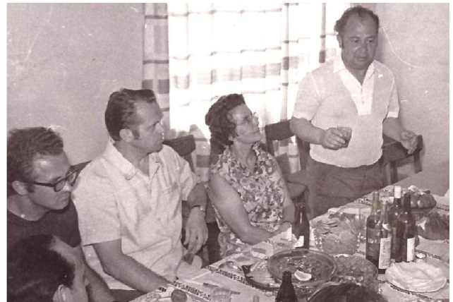
Пятрусь Макаль у гасцях прамаўляе тост, 1980 г.

Іх любілі дзеці, бо яны напісаны вельмі шчыра, а найперш лёгка чытаюцца: