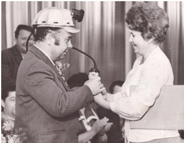
Творчы вечар Пятруся Макаля ў Салігорску, 1976 г.

не пакідала паэзія. "Ён быў паэтам, які востра і балюча адчуваў жыццё, чуйна і імгненна выбухаў сэрцам на ўсе яго змены і ўзрушэнні", - пісаў пра яго Казімір Камейша.