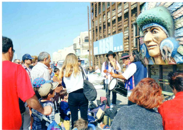
Тэль-Авіў, ансамбль ШФ300