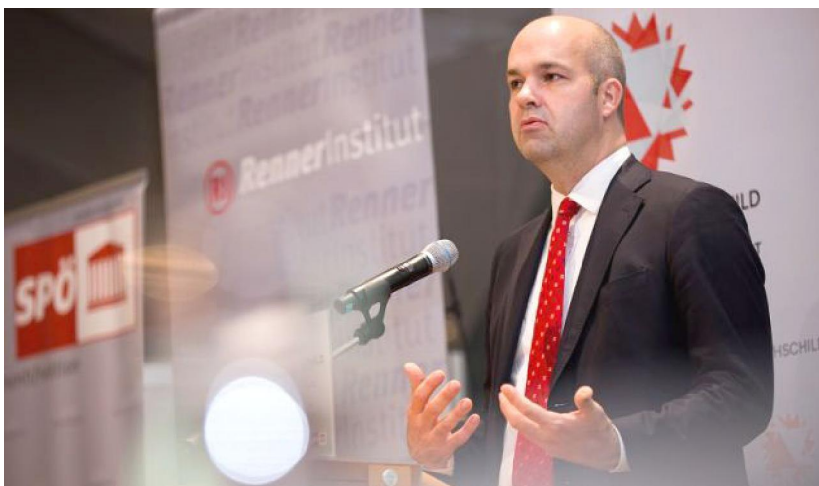
Марсэль Фратцшэр.

На пытанне, ці могуць дзяржаўныя фінансы вы-