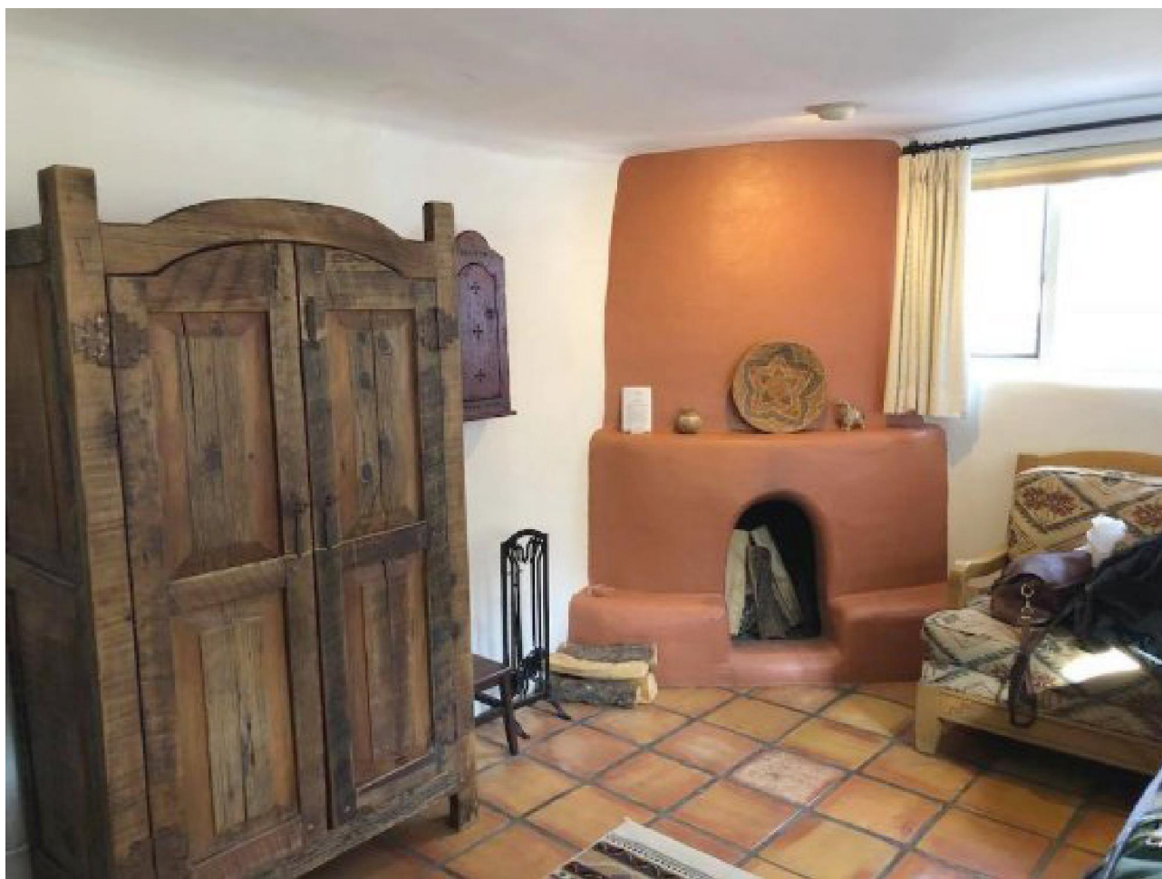
Пакой Стравінскага ў гасцініцы Бірузовага Мядзведзя ў Санта - Фэ

Супрацоўніцтва Стравінскага і Толчыф згадваецца на велізарнай колькасці вэб-старонак, шматлікія публікацыі, дзе яны сустракаюцца на адной старонцы, уключаюць і дзіцячую энцыклапедыю, складзеную індзеяністам Ю. Катэнкам, - "Індзейцы" (Котенко Ю. Индейцы (Серия: Детская энциклопедия. № 10 2002). М.: Аргументы и факты, 2002. 48 с. ). Марыя сведчыць пра Стравінскага ў кнізе "Індзейскія балерыны" Л. К. Лівінгстан. Гэта сапраўдная культурная класіка. У гэтым дыялогу і сінтэзе культур і музычных стыляў, галасоў старажытных Амерыкі і Русі мы можам назваць Стравінскага рускім і беларускім Дворжакам.