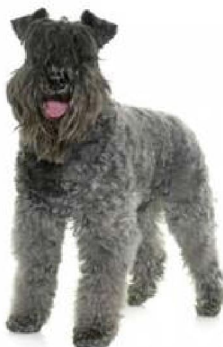
Керы блю тэр'ер

1 - Сабакі-пастухі і быдлагонныя сабакі, акрамя швейцарскіх быдлагонных сабак, Іспанія