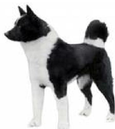
Карэльскі мядзведжы сабака

5 - Шпіцы і прымітыўныя пароды, Фінляндыя