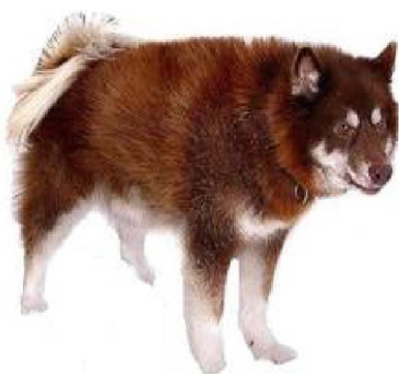
Канадскі эскімоскі сабака

9 - Дэкаратыўныя і сабакі-кампаньёны, Францыя, Бельгія