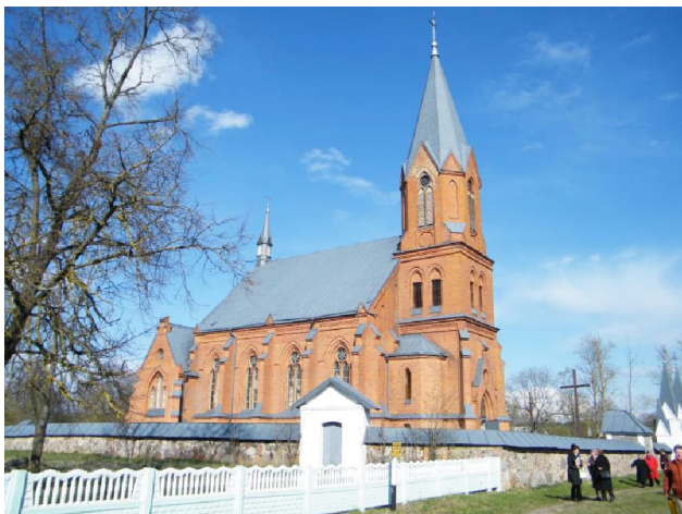
Касцёл Св. Уладзіслава ў Суботніках

лёхах касцёла. Надмагілле с. п. Альберта зроблена на ўзор знешняй табліцы віленскай капліцы святога Казіміра. На процілеглай сцяне, над мармуровай і бронзавай хрысціянскай ніцай, знаходзіцца выява заснавальніка. Побач з апсідай маецца ложа калятараў з асобным уваходам. У бакавым алтары прыгожая Мадонна ў атачэнні святых, намалёваная Мардасевічам. Вакол келецкі мармур, па-мастацку каванае жалеза паўтарае геральдычны матыў лілей, бронза і вытанчана апрацаваны дуб. На хорах добры арган. Усё гэта стварае цудоўнае ўражанне. Багата і годна.