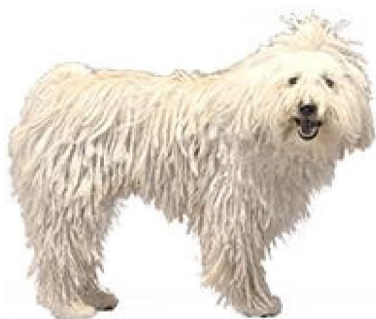
Камандор, ці венгерская аўчарка

1 - Сабакі-пастухі і быдлагонныя сабакі, акрамя швейцарскіх быдлагонных сабак, Венгрыя