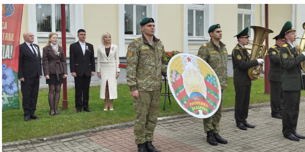
ТК "Культура Лідчыны".

Дзяржаўныя знакі - гэта наша гісторыя, наш гонар і аснова нашай будучыні!