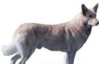
Кан дэ палейра

1 - Сабакі-пастухі і быдлагонныя сабакі, акрамя швейцарскіх быдлагонных сабак, Венгрыя