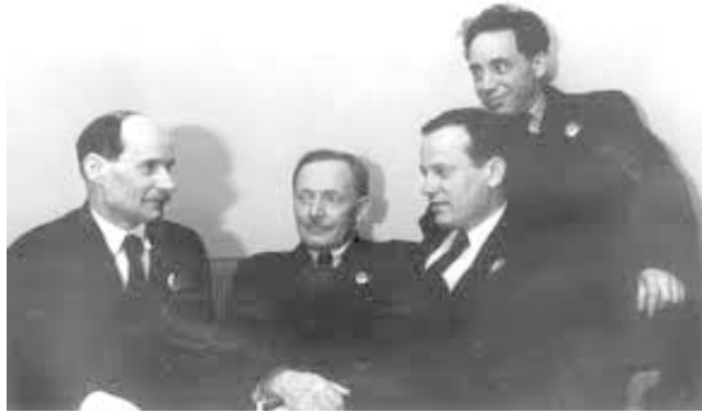
Беларускія літаратары ў 1939 г.

Збіты кайданы чорнае ночы, Сцёрты старыя скрыжалі. Смела наперад, люд наш рабочы,