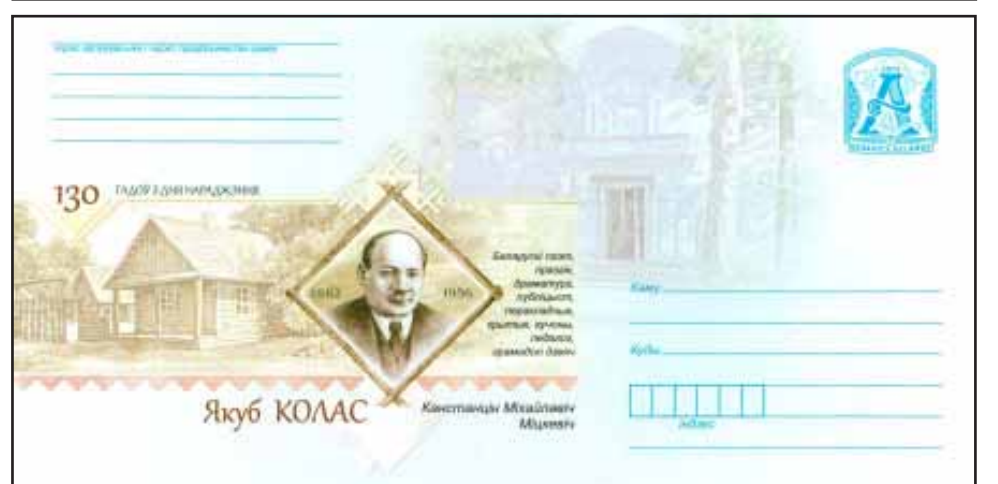
Мастацкі канверт, выпушчаны "Белпоштай" да 130-годдзя Якуба Коласа

Літаратурную дзейнасць пачаў у 1908 г. на старонках "Нашай нівы". Выдаў зборнікі паэзіі "Песні" (1913), "Пес-