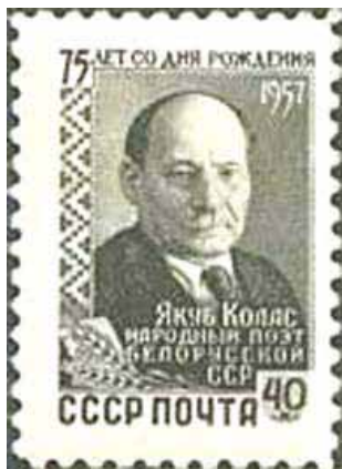
Савецкая марка да 75-годдзя Я. Коласа

Як хацелася мне трапіць на вечар! Але як? Выручыў дружкаўскі аддзяленні беларускай мовы і літаратуры нашага філфака, пры якім існавала аддзяленне журналістыкі, Віктар Несцяровіч. А з ім я пасябраваў адразу, спяваючы ва