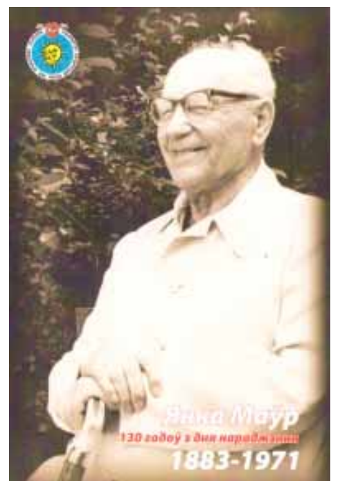
Паштоўка да 130-годдзя Янкі Маўра, выдадзеная ТБМ. Дызайн І. Марачкіна.

Дэбютаваў у 1923 фельетонамі ў газеце "Савецкая Беларусь" і лінгвістычным часопісе "Бегемот". З першым апавяданнем выступіў у друку ў 1926 (часопіс "Беларускі піянер"). Аўтар кніг аповесцей, апавяданняў "Чалавек ідзе" (1927), "У краіне райскай птушкі" (1928,