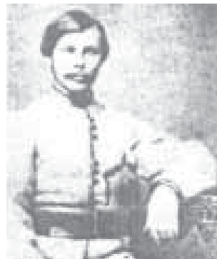
Францішак Багушэвіч - паўстанец з аддзела Людвіка Нарбута

Развіццё беларускай культуры ішло ў межах літвінскай і заходнерускай культурных традыцый, і беларускасць шмат у чым з'явілася іх сплавом. Ужо ў 1870-80-х гадах беларускія народнікі выступілі з абгрунтаваннем тэзы пра беларусаў як асобны народ. Сімвалічна, што на канчатковае афармленне беларускай культурнай традыцыі сваёй творчасцю моцна паўплываў паўстанец 1863 г. Францішак Багушэвіч. Пасля яго станаўленню беларускай