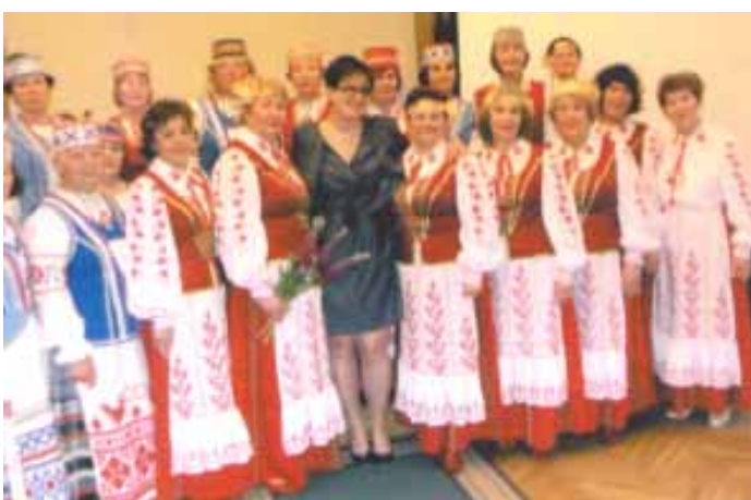
Абодва калектывы з прадстаўніцай амбасады Рэспублікі Беларусь у Эстоніі

але ёсць народ. У Беларусі многа насельніцтва, але не відаць народа.