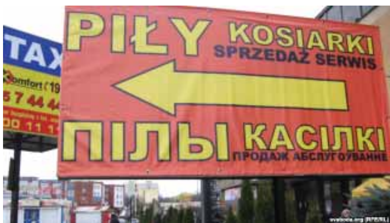
Рэклама на польскай і беларускай мове каля аўтавакзала ў Беластоку.