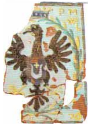
Княжацкі герб Палубінскіх (герб А. Г. Палубінскага, 1670 г.)

Выводзіліся паводле ўласнага радаводу ад Андрэя Альгердавіча, гэта ўскосна пацвярджаецца тым фактам, што