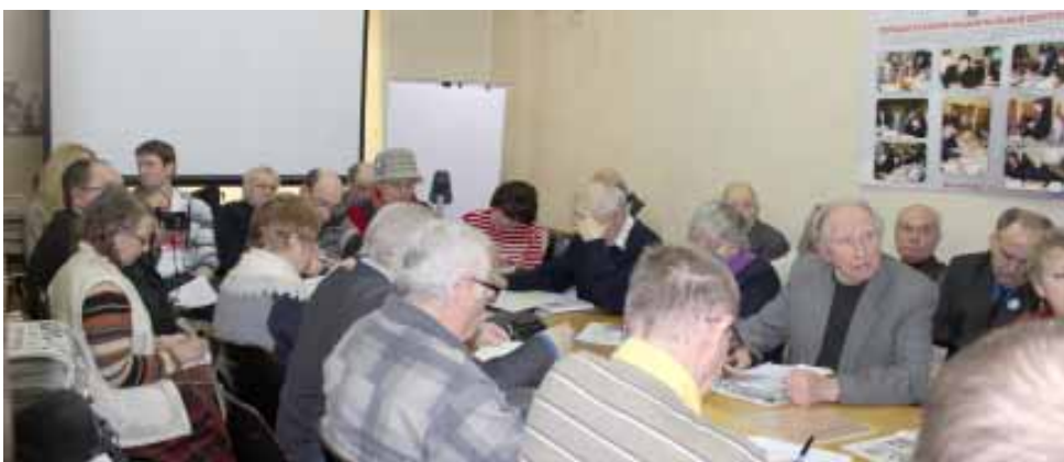
(Заканчэнне. Пачатак на ст. 1.)

Не без спрэчак быў прыняты і План дзейнасці Грамадскага аб'яднання "Таварыства беларускай мовы імя Ф. Скарыны" на 2016 год.