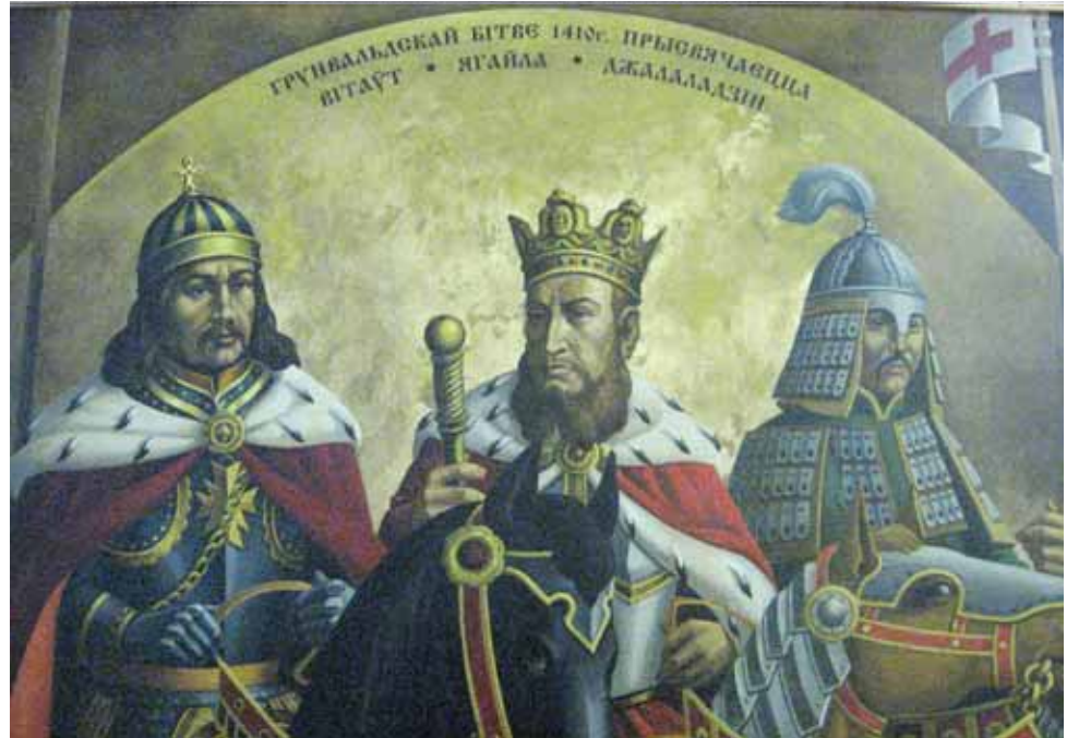
Эдуард Рымаровіч. Грунвальдскай бітве прысвячаецца (фрагмент карціны). 110x130. Палатно, алея. 2010 год.

Тэхнічныя дасягненні не маглі не зрабіць свой унёсак: заклік да малітвы гучыць не з вуснаў муэдзіна, а праз апаратуру ў запісе - гук рэгулюецца, каб не трывожыць месцічаў. Прынамсі, ніхто з іх не выказаў абурэння - вельмі напеўныя гукі хутчэй супакойваюць і, міжволі, ствараюць атмосферу шматгалосся, адпа-