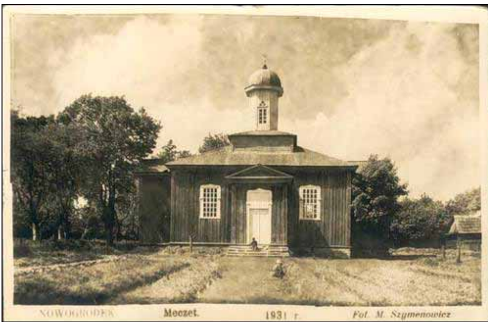
1931 год.

У 1921 г. ў Наваградку жыло 335 мусульманаў (5,7% ад агульнай колькасці жыхароў горада), у 1938 г. - 766 татараў. Пасля вайны фіксуецца зніжэнне татарскага насельніцтва ў месцах іх ранейшага кампактнага пражывання. Магчыма, узніклі абставіны - у тым ліку змешаныя шлюбы - калі дзеці запісваліся як беларусы ці паліякі. Цяпер тых, хто ідэнтыфікуе сябе татарамі налічваецца крыху больш за 300 чалавек. (Працяг у наст нумары.)