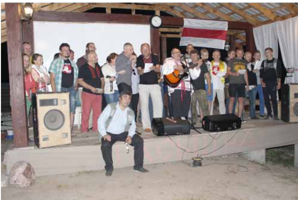
Фінальная песня тых, хто датрываў да канца 5-ці гадзіннага канцэрту