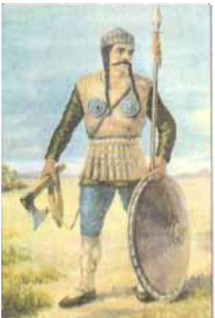
Франкскі ваяр (рэканструкцыя паводле матэрыялаў раскопак).

Менавіта Хлодвіг прыняў хрысціянства, што спыніла варажасць паміж рымлянамі і франкамі і забяспечыла яго падтрымку мясцовага духавенства. Пасля ягонай смерці ў 511 г. да ўлады прыйшлі яго сыны ды іх нашчадкі. Да сярэдзіны VI ст. франкі заваявалі землі баварцаў, цюрынгаў і