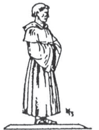
Сярэднявечны манах (з даўняга малюнка).

Манаства ў Заходняй Еўропе. Першыя манахі з'явіліся ў Егіпце і на Блізкім Усходзе на мяжы III-IV стст. Слова " манах " на старагрэцкай мове абзначала " адзінокі ". Спачатку гэта былі пустэльнікі, якія асобна і вельмі аскетычна жылі на бязлюддзі: яны ўвесь час маліліся і думалі пра Бога. Некаторыя з іх замураўвалі сябе ў пячорах або будынках ці сцялілі ў драўляных калонах, з якіх гадамі не выходзілі. Іх называлі стоўпнікамі ("слупнікамі"), бо яны жылі на слупах (паміж небам і зямлёю).