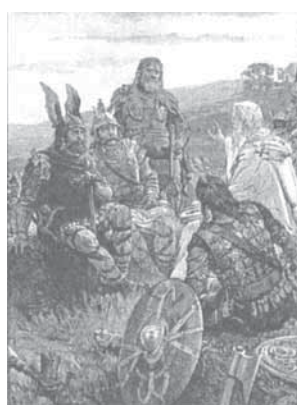
Біскуп Вульфіль тлумачыць Евангелле вернікам.

Некаторыя манахі пачалі жыць супольна, групамі пад кіраўніцтвам больш сталага манаха, якога звалі абатам (ад стараабр. " абба " - "бацька"). Першы такі манастыр узнік у Егіпце ў 328 г. Неўзабаве ўзніклі і жаночыя манастыры, але пустэльніцтва было выключна мужчынскай справай. У V ст. манастыры (кляштарны) з'явіліся і ў Заходняй Еўропе. Кожны вернік мог стаць манахам. Але дзеля гэтага ён павінен быў даць тры зарокі: жабрацтва, жыццё без шлюбу, паслушэнства абатам. Манахі павінны былі працаваць і забяспечваць саміх сябе ўсім неабходным.