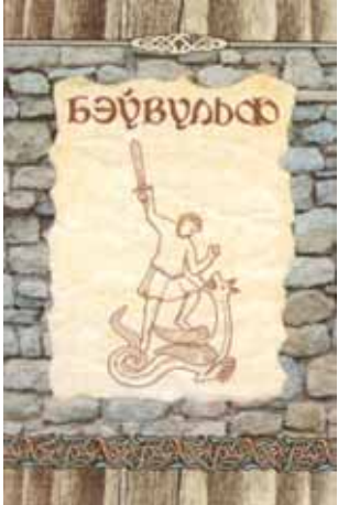
Вокладка сучаснага беларускага выдання паэмы "Бэўвульф".

Падзеі старадаўняй гісторыі англасаксаў знайшлі сваё ўвасабленне ў міфалагічна-гераячным эпосе, паэме "Бэўвульф", створанай прыкладна ў VIII ст. невядомым аўтарам (сёння вядомы рукапіс, запісаны каля 1000 г.).