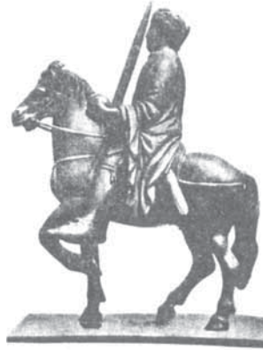
Конная статуэтка Карла Вялікага (IX ст.).

паплечнікаў, звязаная з іх цікавасцю да антычнай культуры, атрымала назву " Каралінскае аораджэнне ".