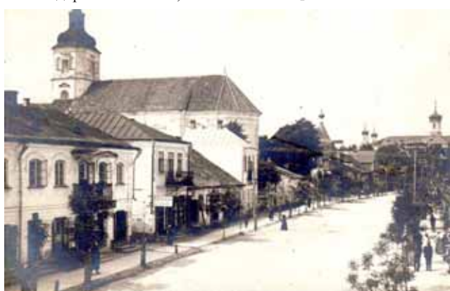
Так выглядаў касцёл у Слоніме (злева), дзе служыў Адам Станкевіч