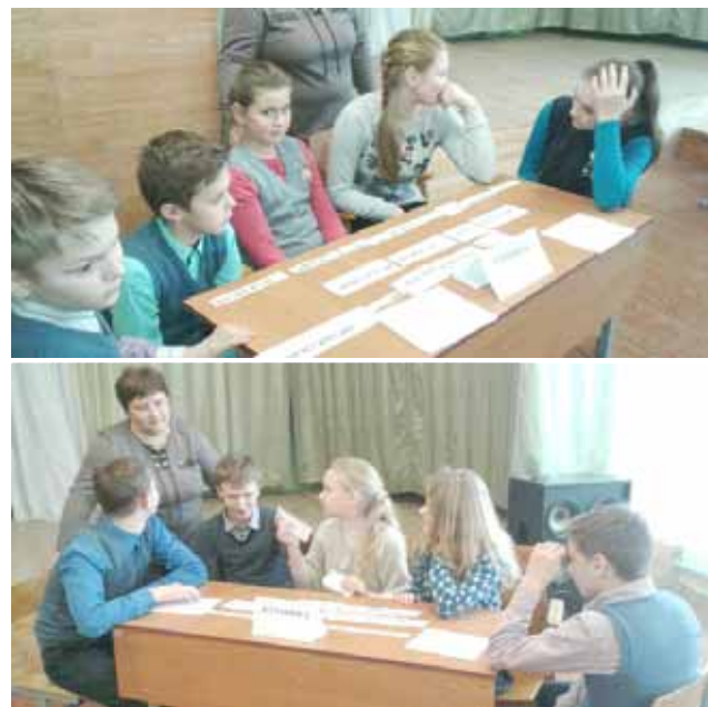
Каманды "Рамонак" і "Журавінка" Першамайскай СШ Лідскага раёна падчас моўнай гульні.