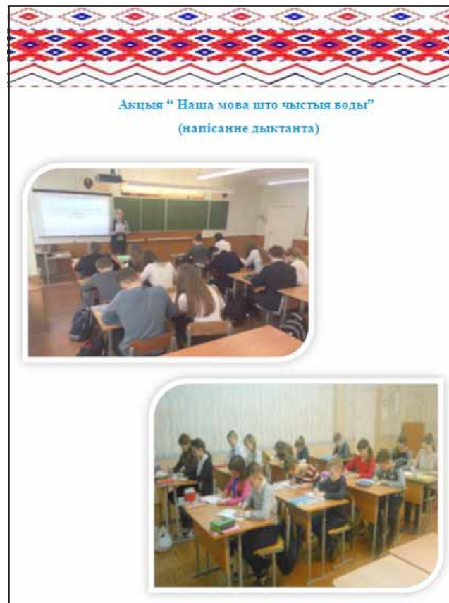
Старонка сайта СШ № 17 г. Ліды, прысвечаная Міжнароднаму дню роднай мовы і X Агульнанацыянальнай дыктоўцы

чалавекі - у Ваверскай СШ і г.д. Дыктоўкі праводзіліся па класах, магчыма недзе ў сельскіх школах класы аб'ядноўвалі, але ў цэлым у школах прайшло каля 240 дыктовак.