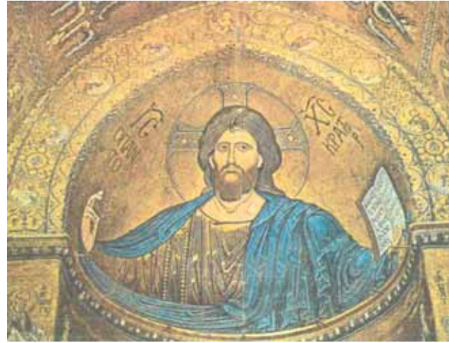
Хрыстос-Пантакратар. Каля 1180-1194 гг. Манрэале (Сіцылія), кафедральны сабор. Мазаіка ў канцы абсіды.

сінтэт існаваў да 1209 г. і быў адным з самых вядомых навуковых цэнтраў тагачаснага свету, разам з Парыжам і Багдадам. Існаваў універсітэт за дзяржаўны кошт і меў моцны дзяржаўны кантроль. На мяжы XI-XII стст. вышэйшыя школы з'яўляюцца і ў іншых гарадах краіны, напрыклад, у Салоніках.