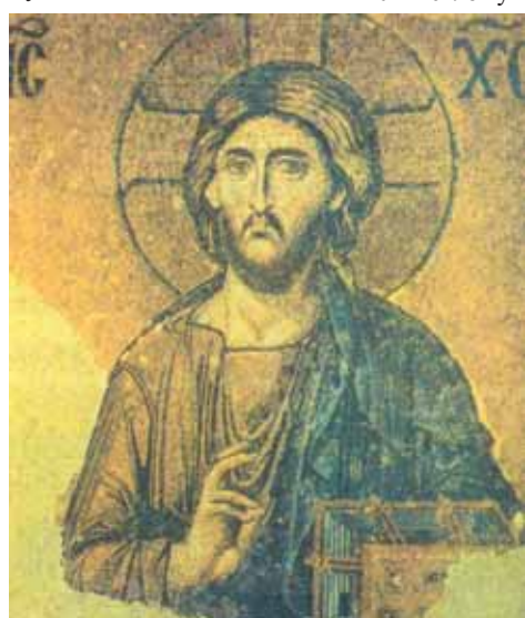
Ісус Хрыстос. Другая палова XII ст. (Сабор св. Сафіі ў Канстанцінопалі)

Вельмі высокага ўзроўню ў Візантыі дасягнула літаратура. У X ст. былі складзены энцыклапедыі па гісторыі, сельскай гаспадарцы і медыцыне. Вялікую папулярнасць набылі трактаты імператара Канстанціна Парфірагенета (913-959). У X ст. быў напісаны слоўнік