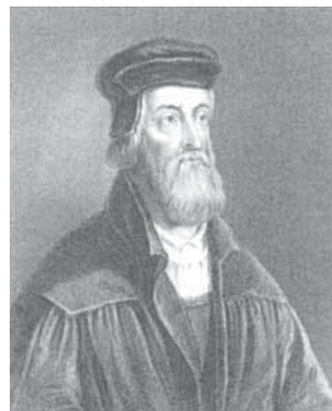
Джон Уікліф. З сярэднявечнай гравюры.

100 гадоў. Ён быў звязаны з тым, што рымскія папы трапілі пад уплыў Францыі. Лідарам гэтага руху стаў Джон Уікліф (1320-1386) - святар, багаслоў, прафесар Оксфардскага ўніверсітэта. Ён лічыў, што духоўная ўлада павінна быць падначалена свецкай уладзе, а царква мусіла адмовіцца ад зямельнай маёмасці. Менавіта ён пераклаў Біблію з лацінскай на англійскую мову. Спачатку ён набыў вялікую папулярнасць у краіне, але пасля сялянскага паўстання 1381 г. улады пачалі баяцца ўплыву яго ідэй на проста народ і перасталі яго падтрымліваць. Уікліф пакінуў Оксфард і неўзабаве памёр.