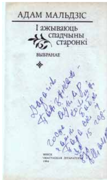
Аўтограф Адама Мальдзіса на кнізе "І ажываюць спадчыны старонкі". 1994 г.

Будучыня, моцны твой падмурак! Для усіх - зямля і землякоў - вырасталі помнікі культуры, памяць нерастратаных вякоў. Мы - ахова памяці і працы.