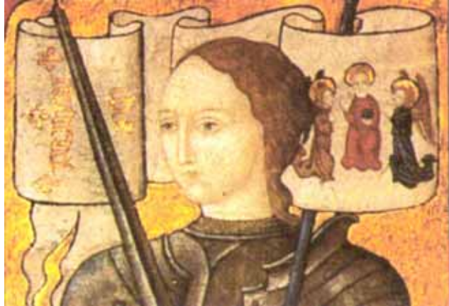
Жанна д'Арк. Сярэднявечная мініяцюра.

аблозе. Дафін дазволіў ёй далучыцца да войска і фармальна яго ўзначаліць. У сапраўднасці ім, вядома, кіравалі дасведчаныя камандзіры-прафесіяналы. Жанна надзела рыцарскія даспехі і прыняла непасрэдны ўдзел у баях. 8 траўня аблога Арлеана была знятая, і англічане