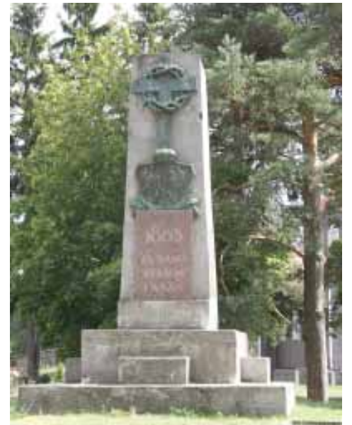
Ф. Рушчыца, Балзукевіч. Помнік паўстанцам 1863 года ў Дубічах, у аснову якога закладзены пастамент віленскага помніка Мураўёву-Вешальніку.

На вясковых могілках пры касцёле ў Дубічах пахавалі Нарбута і яго жаўнераў.