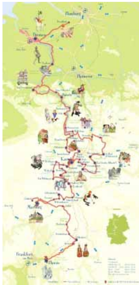
Казачная дарога. auto-neva.ru

Практычна ва ўсіх гарадах на шляху праводзяцца