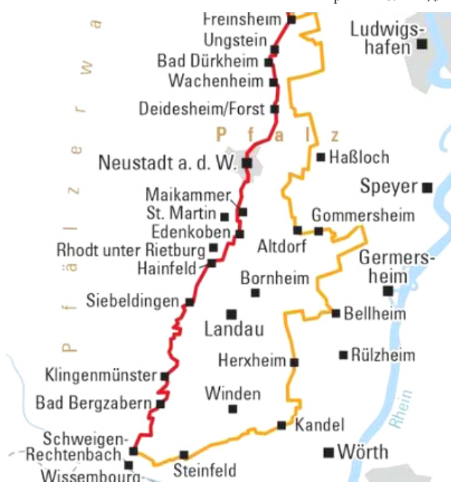
Вінная дарога. adfc-radtourismus.de

калядны сезон, калі мноства калядных кірмашоў дададуць шарм і каларыт у вашу вандроўку.