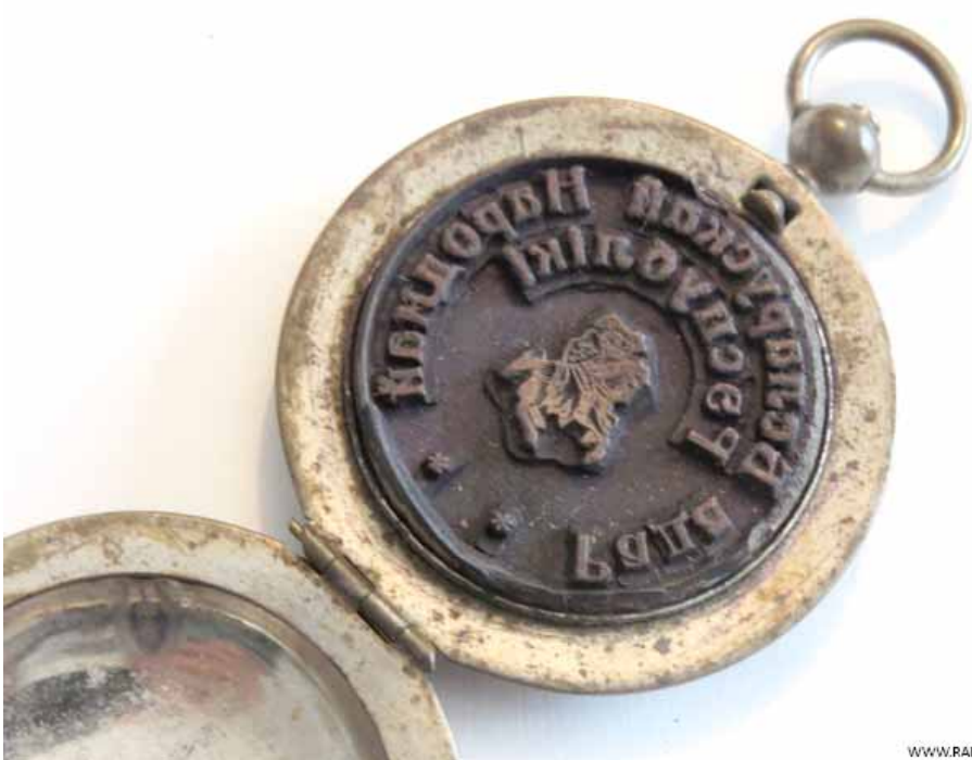
28 красавіка 1918 года афіцыйна ўведзена ў дзеянне пячатка Рады БНР з Пагоняй і з надпісам на адзінай дзяржаўнай мове - беларускай.