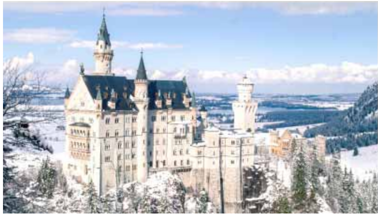
Замкавая дарога вядзе да Нойшванштайн

Па дарозе вы зможаце палюбавацца баварскай прыродай, казачнымі гарадамі, абабітымі дрэвамі хатамі, манастырамі і рамантычнымі заезнымі дварамі. Таксама не забудзьцеся наведаць Вюрцбург, Ро-