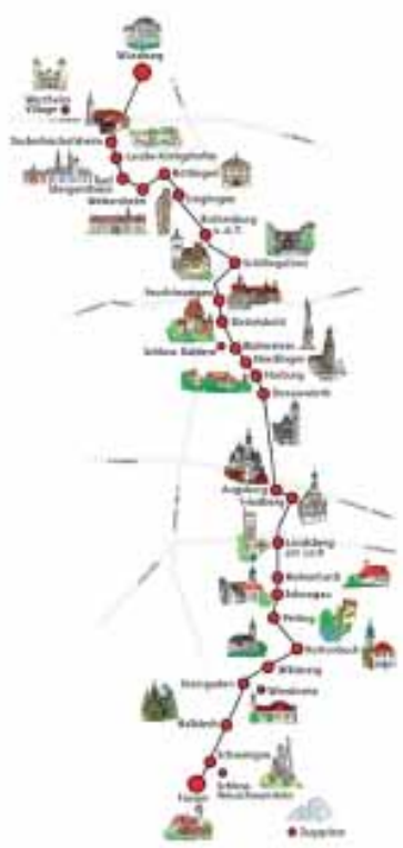
Рамантычная дарога. tuttobaviera.it

Хочаце, каб кроплі вашага фізічнага і духоўнага заставаліся ў свеце - успамінайце забылае, прыкметы тавае. Абнаўляйцеся. Не літвін, русін, жмудзін, маскавіт. Нават каб дапячы літоўцам, то бок беларусам іхнюю карэнную назву перанеслі на Жмудзь, сімвалам якой быў мядзведзь, а не