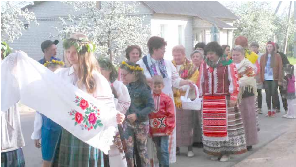
Шэце на Беліцы

У аграгарадку Беліца Лідскага раёна 5 траўня адбыўся абрад Юр'е - "Юр'еў карагод". Згодна з павер'ем, Сьвяты Юрай адмыкае зямлю, выпускае расу і распачынае рост усякай расліннасці, тым самым забяспечвае багаты ўраджай на ўвесь год. Вось і жыхары вёскі, а таксама работнікі філіяла "Беліцкі Дом культуры" ДУ "Лідскі раённы цэнтр культуры і народнай творчасці" сабраліся, каб паўдзельнічаць у гэтым народным свяце. Прыгожы абрад з'яўляецца традыцыйным для аграгарадка Беліца і збірае заўсёды шмат гледачоў, сярод якіх шмат людзей сталага ўзросту. У гэтым годзе фальклорнае свята прымеркавана да Года малой радзімы.