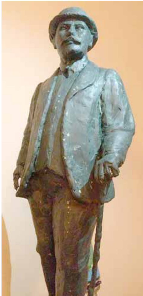
Макет помніка Юліюсу Столе