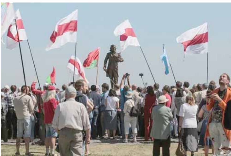
Тадэуш Касцюшк пад роднымі сцягамі

Сотні людзей з'ехаліся на ўрачыстае адкрыццё помніка Тадэвушу Касцюшку на ягонай радзіме ў Косаве. У адозненне ад штогадовых ушанаванняў Касцюшкі ў дзень яго народзінаў, сёння на ўрачыстасцях было шмат бел-чырвона-белых сцягоў.