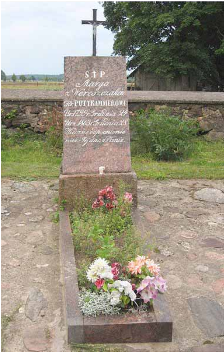
Магіла Марылі Верашчакі, сучасны выгляд