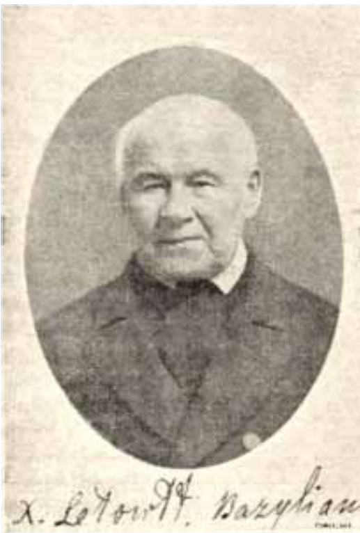
А. Кірыл Летаўт. Фота Юзафа Чаховіча, 1860-я гг.

У чарговым лісце да Казіміра Максевіча ад 09.01.1888 г. базыльянін піша: "Сто разоў дзякую за продаж футра і за вашы клопаты". Потым горача запэўнівае, што не забывае сваіх дабрадзеляў і сяброў у Літве, жадае ім вясёлых святаў Новага года і дадае: "Тут я спакойна жыю і пачуваюся здаровым, хоць мае гады моцна пасунуліся наперад. Зіма ў нас таксама лютуе, але не так моцна, як у вас, бо мы заслонены гарамі. Божае Нараджэнне мы мелі вельмі вясёлае".