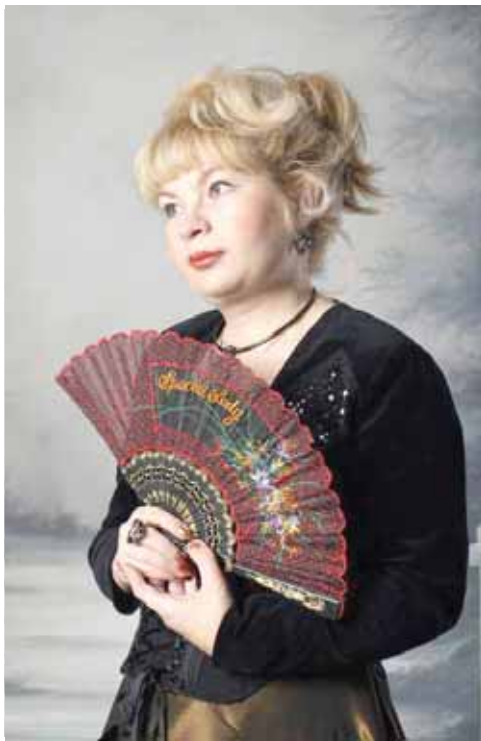
Аўтар тэкста Марыя Цітарчук

як варыянт прасоўвання мовы, азнаямлення маладых людзей (першым чынам, як мне здаецца) "Агульная дыктоўка" - вельмі цікавая задумка. Упэўнены, што нават у выпадку "завалу" дыктоўкі многія ўсміхнуцца і захочуць дазнацца, што ж яны не так напісалі, дзе памылкі і як палепшыць свае веды, каб хоць бы перад сабой не было сорамна.