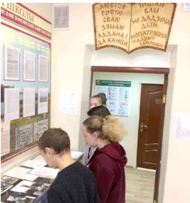
У школьным музеі вёскі Барздоўка