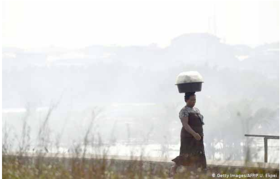
Смог у Нігерыі.

Падчас анлайн-канферэнцыі ва ўгодкі Парыжскай дамовы Меркель паабяцала выдзеліць 500 мільёнаў еўра для падтрымкі бедных краін у барацьбе са зменай клімату.