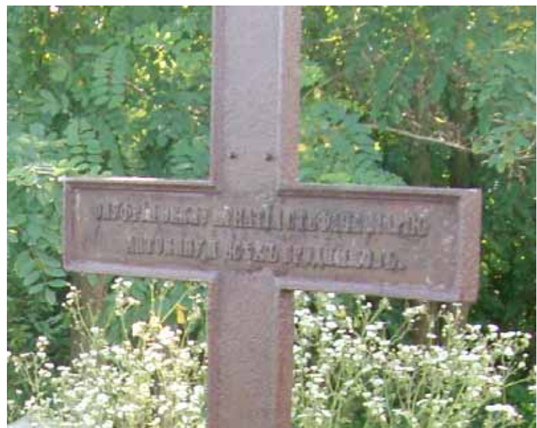
Фота 9. Крыж усталяваны ў 1880г. Іванам Карскім сваім родным на могілках у Лашы.

11. Спраба ідэнтыфікацыі родных Яўхіма Карскага, напісаных на старым металічным крыжы на могілках у Лашы, верагодна пастаўленым Іванам Ануфрыевічам Карскім. Пасля знаходкі ў архіве імёнаў жонак і дзяцей, 4 сыноў Вікенція Якаўлевіча Карскага, можна бліжэй падысці да адкажу, каму з родных Я. Карскага належыць імёны, напісаныя на крыжы: "Онуфрыя, Фёклу, Ігнатія, Стефана, Марію, Антоніну, і всех сродников".