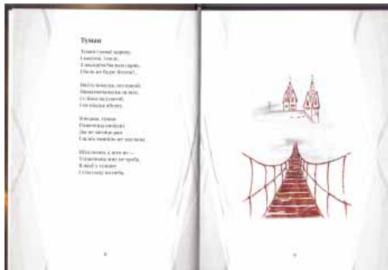
Верш з малюнкам дачкі

Туман схаваў царкву, І могілкі, і поле. З жыццём былым парву. І боль не будзе болем?..