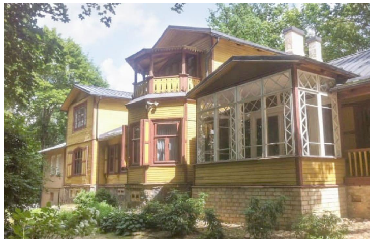
Дом Пушкіных у Маркуцях

У Пушкіна было два сына: Аляксандр і Рыгор. Старэйшы Аляксандр у 1851 г. скончыў Пажскі корпус і ў 1851 г. паступіў у лейб-гвардыі конны полк. У выніку даслужыўся да чына генерал-лейтэнанта кавалерыі і памёр у 1914 г. Пакінуў шмат дзяцей з двух шлюбаў. Ад другога шлюбу меў сына Мікалая і дачку Алену, якія жывуць у Бруселі і Парыжы. З першага - сына Рыгора і дачок Марыю і Ганну. Мікалай спачатку ваяваў з бальшавікамі ў 1-м Сумскім гусарскім палку, потым у