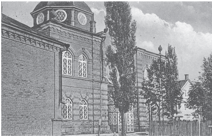
Лидская синагога (1907-1916)