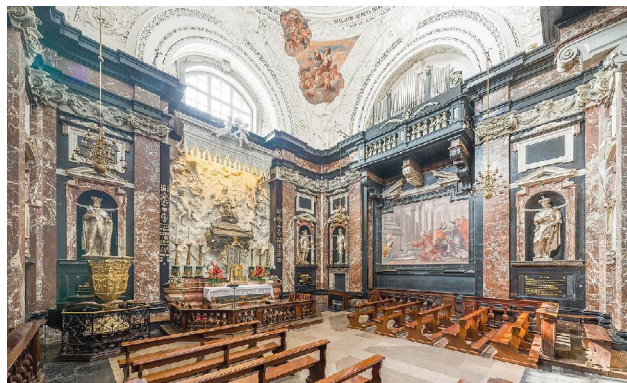
Інтэр'ер Віленскай катэдры

Калі наступілі панурья часы пад Масквой, біскуп і капітула пакінулі Вільню. Яны вывезлі з сабой рэліквіі св. Казіміра, акты дыяцэзіі і капітулы, каштоўнасці. Першая сесія капітулы па-за Вільняй адбылася ў капітульным маёнтку Брашэвічы 3 лютага 1656 г. Хутка стала вядома, што ў Каралюўцы памёр біскуп Тышкевіч. 15 траўня на пасаду віленскага біскупа кароль намінаваў віленскага пралата Завішу-Даўгялу. Але і той памёр у бежанстве. У траўні 1658 г. пралат Бялазор прыехаў у Берасце ў якасці намінанта на пасаду смаленскага біскупа. Там у яго спыталі, куды ён падзеў вывезеныя з Вільні кляйноты? Пралат адказаў, што частку перадаў для абароны дзяржавы, а