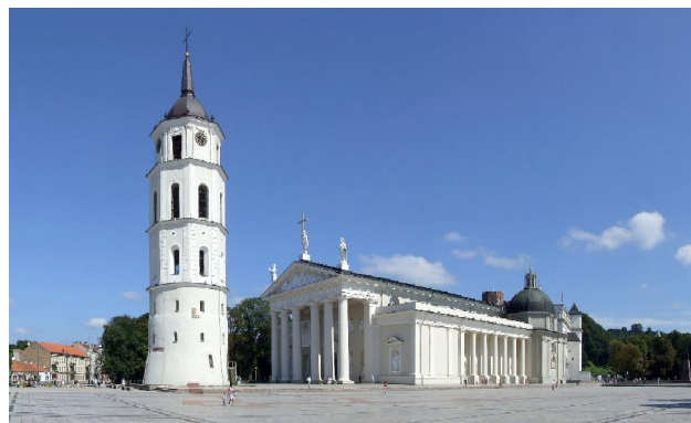
Віленская катэдра, сучасны выгляд

Маем інфармацыю, што косткі Вітаўта ў XVI ст.